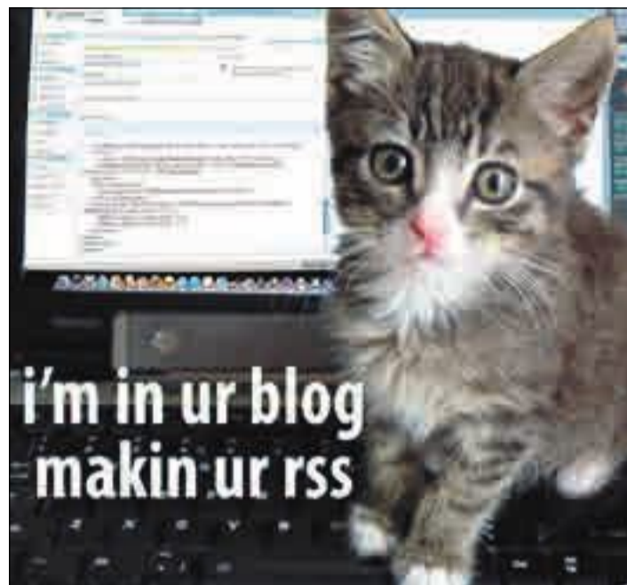
AVANTGARDEKUNST? En kattepus fra internettet.